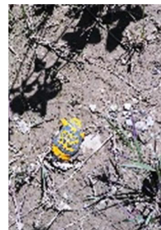
Sonneur à ventre jaune

Il est évident que les problèmes environnementaux sont et seront les problèmes majeurs que nous devons résoudre ces prochaines années. Par ailleurs, nous constatons également que les réserves de matériaux graveleux traditionnels se font de plus en plus rares d'une part du fait de leur épuisement mais aussi parce qu'ils sont de plus en plus difficiles à exploiter en raison d'un conflit avec d'autres utilisations du territoire : territoire bâti, agriculture, forêts notamment. Je suis tout à fait d'accord que nous devons respecter la nature et économiser nos ressources en matières premières, c'est même primordial.