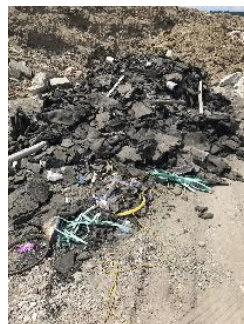
Dépôt sauvage de matériaux bitumineux et autres