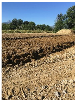
Remise en état de qualité

Exemples tirés de chantiers fribourgeois :