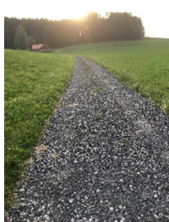
Epandage de fraisat bitumineux frauduleux